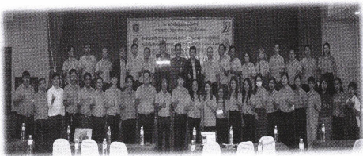
ประชุมเชิงปฏิบัติการ การทบทวน วิเคราะห์ผลการปฏิบัติราชการ และพัฒนาศักยภาพบุคลากรเพื่อเพิ่มประสิทธิภาพในการปฏิบัติงาน ศูนย์สนับสนุนบริการสุขภาพที่ ๑๐ ประจำปีงบประมาณ พ.ศ. ๒๕๖๖